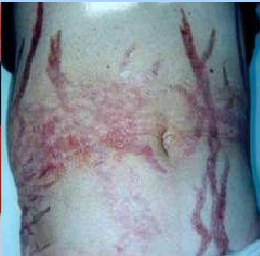
腋前、腹侧皮肤紫纹