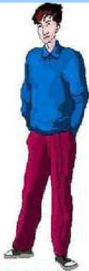
巨人症 幼年时 生长激 素过多