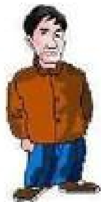
侏儒症 幼年时 生长激 素不足