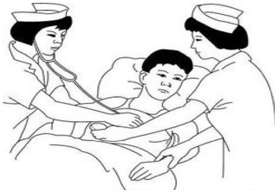
图8—12脉搏短绌测量法